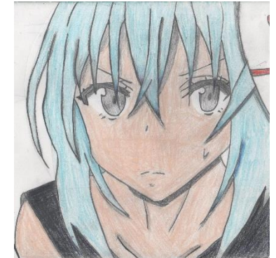
「転スラ リムル」模写 りく君 12歳