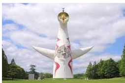
万博公園のシンボル太陽の塔