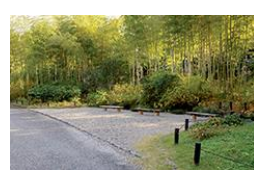
昔の姿をとどめる竹林

竹林や雑木林だった千里丘陵を伐採して、1970年に万国博覧会が開催されました。その跡地はほとんど砂漠のような裸地でしたが、多くの樹木を植え、手入れをしながら自然の森にする計画が実行されました。特に珍しいものではなく大阪周辺に自生している樹種を選んで計画的に植栽しました。そして50数年がたち、今では木々は大きく育ち、キツネやタヌキ、野鳥や昆虫、カエルやイモリ、川魚なども棲むようになり、半世紀を経て一つの生態系として成長しつつあります。都会の真ん中でも時間をかけて保全すれば自然は回復力を持っているという実証実験の成功例です。