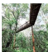
ソラード(森の空中観察路)と上からの眺め